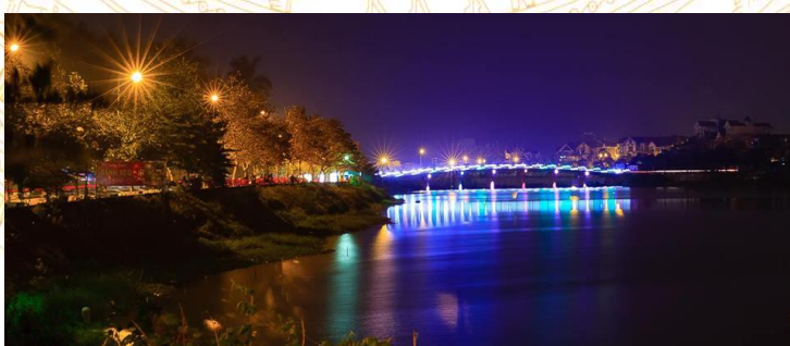
Kết thúc chương trình./.