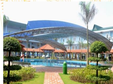
Khu DL Đảo Ngọc Xanh