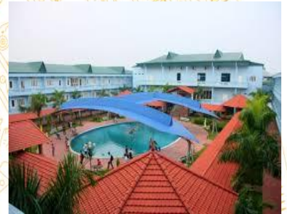
Khu DL Đảo Ngọc Xanh