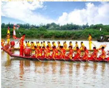
Hội thi bơi chải