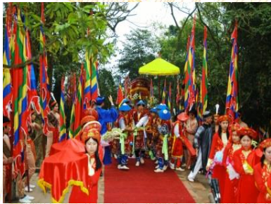
Rước kiệu truyền thống