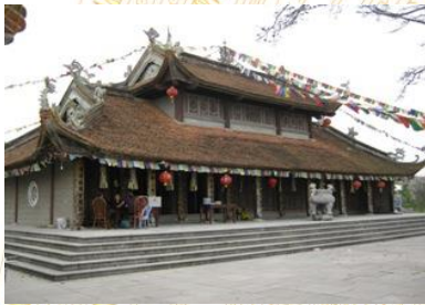
Đền chùa Tam Giang