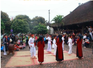
Hát Xoan làng cổ

Ngày 1 - Buổi sáng: Đón đoàn tại Đền Hùng. Đoàn dâng hương và tham quan khu di tích lịch sử Đền Hùng. Đoàn ăn trưa tại Đền Hùng hoặc TP.Việt Trì.