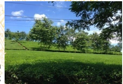
Đồi chè trung du

- Buổi tối: Đoàn tự do thăm quan thành phố hoặc tại khu di tích, tham gia các hoạt động hội; thường thức nghệ thuật, xem liên hoan hát xoan và dân ca Phú Thọ, tham quan trung tâm thành phố... Đoàn nghỉ đêm tại khách sạn .