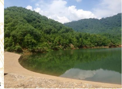
Hồ trên núi