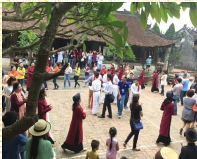
Du khách với hát Xoan

Đoàn tự do thăm quan thành phố. Tham quan Bảo tàng Hùng Vương, công viên Văn Lang, quảng trường Hùng Vương; Tham gia các hoạt động hội tại thành phố; Tham quan, mua sắm tại Hội chợ Hùng Vương, hệ thống siêu thị. Nghỉ đêm tại khách sạn.