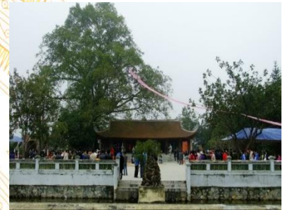
Đền Mẫu Âu Cơ