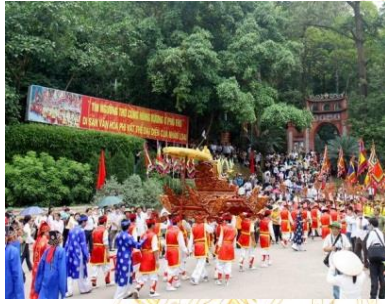
Rước kiệu truyền thống

PHU THO Vietnam Your gateway to a higher place