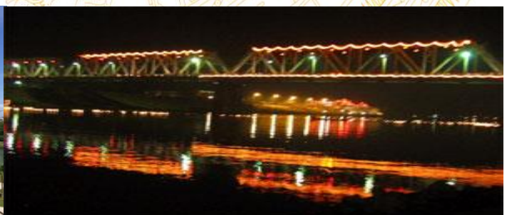
Việt Trì – Thành phố ngã ba sông