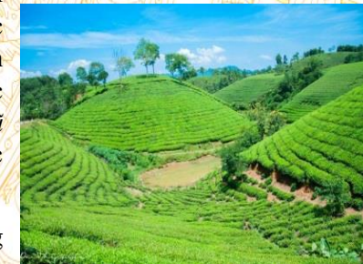
Đồi chè trung du