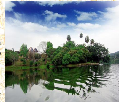
Đầm Ao Châu