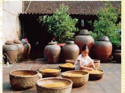
Làng nghề truyền thống