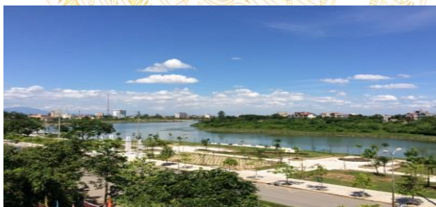
Một góc công viên Văn Lang