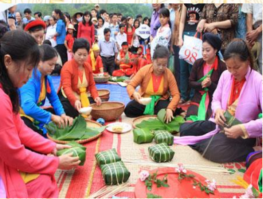
Thi bánh chưng bánh giầy

Ngày 1 - Buổi sáng: Đón đoàn tại thành phố Việt Trì. Đoàn thăm Bảo tàng Hùng Vương, tham dự triển lãm ảnh “ Tín ngưỡng thờ cúng Hùng Vương - bản sắc cội nguồn dân tộc”. Đoàn đi thăm và làm lễ tại Đền chùa Tam Giang; Miếu Lãi Lèn, đình Thét. Thường thức hát Xoan làng cổ.