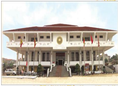
Bảo tàng Hùng Vương