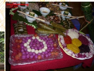
Ẩm thực núi rừng