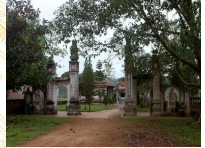
Đền Lãng Suong