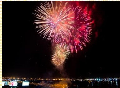
Đêm pháo hoa