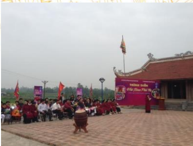
Hát Xoan làng cổ

Ngày 2 - Buổi sáng: Đoàn trả phòng khách sạn, ăn sáng. Khởi hành đi Hạ Hoà. Đoàn tham quan và thắp hương tại Đền Du Yên; Đền Mẫu Âu Cơ, chùa Linh Phúc.