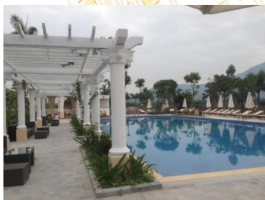
Khu DL nghỉ dưỡng Vườn