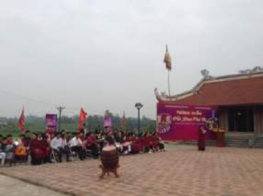
Hát Xoan làng cổ

Ngày 2 - Buổi sáng: Đoàn trả phòng khách sạn, ăn sáng. Khởi hành đi Hạ Hòa. Đoàn tham quan và thắp hương tại Đền Du Yên; Đền Mẫu Âu Cơ, chùa Linh Phúc.