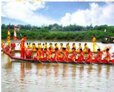
Hội thi bơi chải

- Buổi chiều: Đoàn tắm nước khoáng nóng tại suối nóng Thanh Thủy. Thường thức các món ăn và sản vật địa phương.