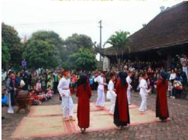
Hát Xoan làng cổ