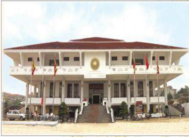
Bảo tàng Hùng Vương