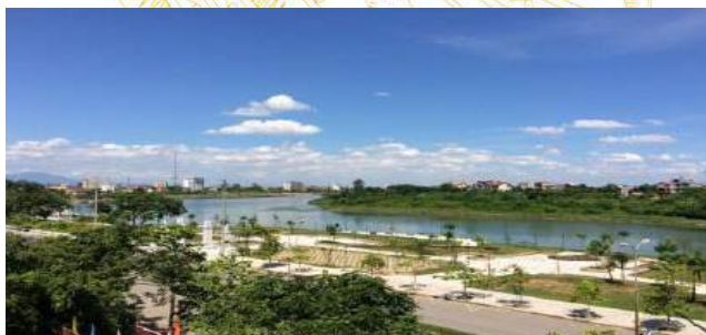
Một góc công viên Văn Lang