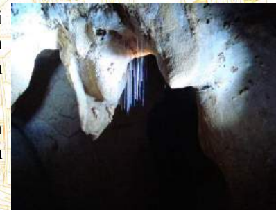
Hang động Xuân Sơn

- Buổi tối: Đoàn ăn tối tại Việt Trì. Đoàn tự do thăm quan thành phố, tham gia các hoạt động văn hóa thể thao tại thành phố... Nghỉ đêm tại khách sạn.