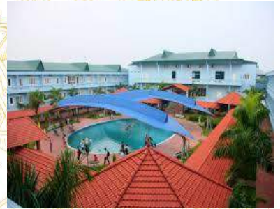
Khu DL Đảo Ngọc Xanh