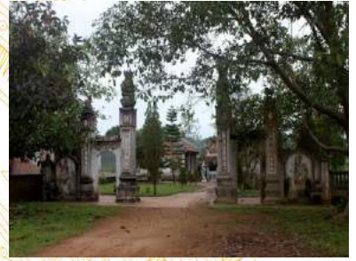
Đền Lãng Suong