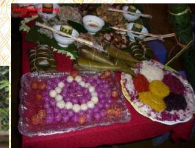
Âm thực núi rừng