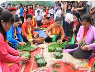
Thi bánh chưng bánh giầy

Ngày 1 - Buổi sáng: Đón đoàn tại thành phố Việt Trì. Đoàn thăm Bảo tàng Hùng Vương, tham dự triển lãm ảnh “Tin ngưỡng thờ cúng Hùng Vương - bản sắc cội nguồn dân tộc”. Đoàn đi thăm và làm lễ tại Đền chùa Tam Giang; Miếu Lãi Lèn, đình Thét. Thường thức hát Xoan làng cổ.