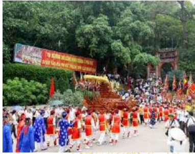
Rước kiệu truyền thống

PHU THO Vietnam Your gateway to a higher place