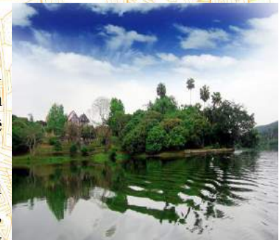
Đầm Ao Châu

- Buổi tối: Đoàn tự do thăm quan thành phố hoặc tại khu di tích, tham gia các hoạt động hội; thường thức nghệ thuật, xem liên hoan hát xoan và dân ca Phú Thọ, tham quan trung tâm thành phố... Đoàn nghỉ đêm tại khách sạn .