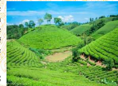
Đồi chè trung du