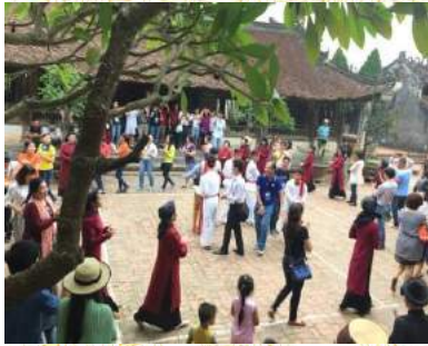
Du khách với hát Xoan

Đoàn tự do thăm quan thành phố. Tham quan Bảo tàng Hùng Vương, công viên Văn Lang, quảng trường Hùng Vương; Tham gia các hoạt động hội tại thành phố; Tham quan, mua sắm tại Hội chợ Hùng Vương, hệ thống siêu thị. Nghỉ đêm tại khách sạn.