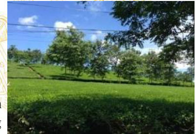
Đồi chè trung du