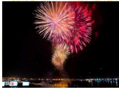
Đêm pháo hoa