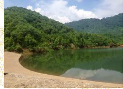
Hồ trên núi