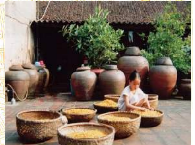
Làng nghề truyền thống