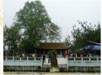
Đền Mẫu Âu Cơ