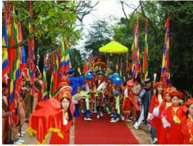
Rước kiệu truyền thống