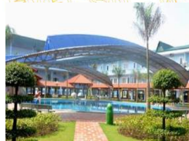
Khu DL Đảo Ngọc Xanh