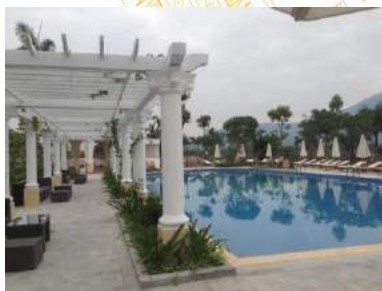
Khu DL nghỉ dưỡng Vườn