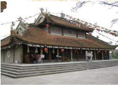
Đền chùa Tam Giang