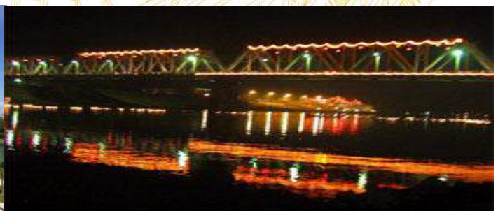
Việt Trì – Thành phố ngã ba sông